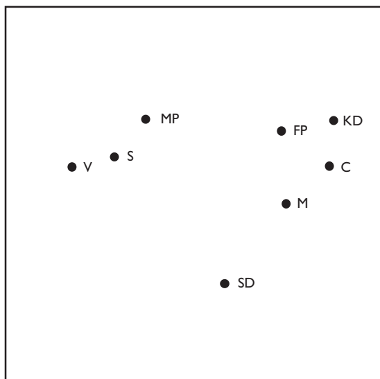
Figur 2 Konfliktstrukturen i det svenska partisystemet 2013. Multidimensionell skalningsanalys byggd på första- och andrahandsympatier (ÖS-mått)

Kommentar: Resultaten är hämtade från en multidimensionell skalningsanalys (MDS) av de sammanlagt tjugoåtta närhetsmåten för ömsesidigt gillande (ÖS). Målet med skalningsanalysen är att erhålla en konfiguration av punkter (partierna) längs en, två eller flera dimensioner, vars inbördes avstånd så väl som möjligt överensstämmer med våra ursprungliga närhetsmått mellan partierna. En bra analogi är de avståndstabeller som visar avståndet mellan olika städer och där en analys av avstånden mellan de olika städerna allt som oftast resulterar i en hyfsat bra karta över Sverige. Passningsmättet för den multidimensionella skalningsanalysen som presenteras i figuren (Stress=.09) berättar att den tvådimensionella kartan passar de ursprungliga närhetsdata (ÖS-måtten) på ett godtagbart sätt; ju lägre passningsmått desto bättre (Kruskal & Wish, 1978). Som alltid är dimensionsanalys en avvägning mellan förenkling och passning. En tredimensionell karta över partisystemet har t ex en ännu något bättre passning än den tvådimensionella (Stress=.02). Passningen för en endimensionell lösning är dålig (Stress=.20).