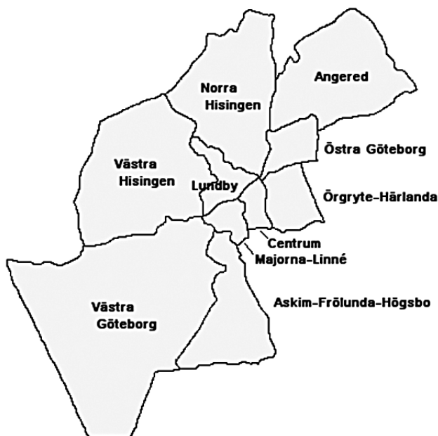
Figur 1 Stadsdelarna i Göteborg efter 2011

Inte desto mindre är det intressant att undersöka om det skett någon som helst förändring i göteborgarnas åsikter om sin stad och sina stadsdelar före och efter 2011. För att i största mån undvika att hitta förändringar som beror på andra faktorer än just SDN-reformen koncentrerar vi oss i denna studie inte på hur göteborgarna bedömer den kommunala servicen som helhet utan hur nöjda de är med just de verksamheter som SDN ansvarar för. Och på det demokratiska området kontrasteras göteborgarnas nöjdhet med den lokala demokratin generellt med möjligheten att påverka i stadsdelarna specifikt. Genom att jämföra göteborgarnas åsikter med andra västsvenskar kan vi försäkra oss om att nöjdhetsförändringar i Göteborg beror på lokala och inte på regionala eller nationella faktorer.